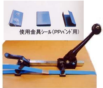
使用金具シール(PPバンド用)