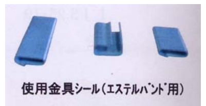
使用金具シール(エステルバンド用)

【特徴】 P Pバンド、エステルバンド用の片締めタイプとして扱いやすく広く使用されています 結束面の平面が小さくても簡単に強力に結束出来ます