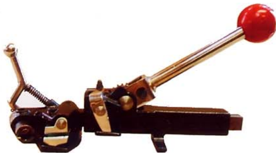
N P S