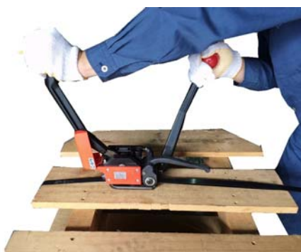
④ 帯鉄のシーリングと切断