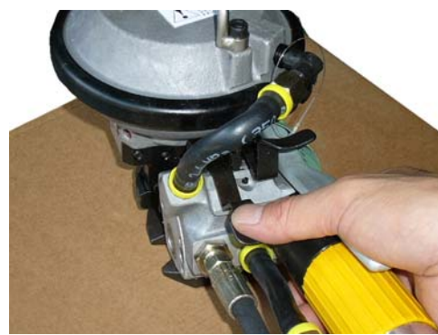
左レバーで封緘と切断