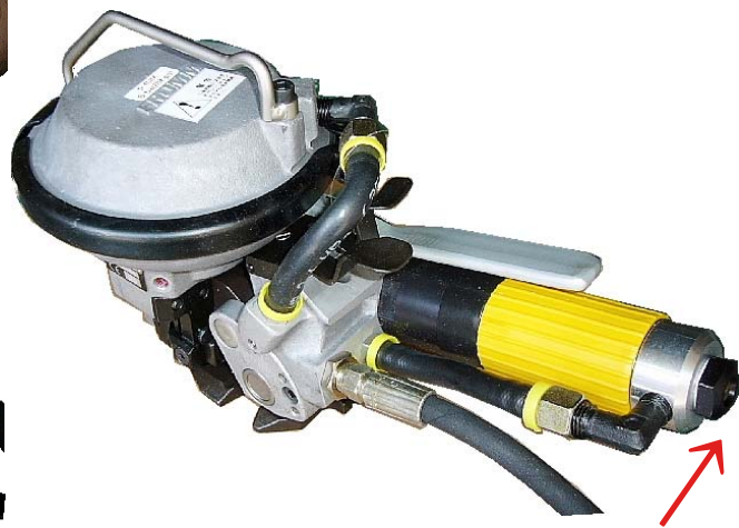
引締め力調整スクリュー