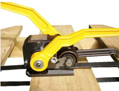
④ 帯鉄のシーリング状態