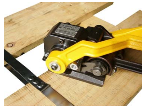
⑥ シールレス結束の完了