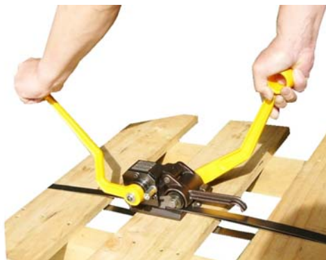
⑤ 帯鉄のシーリングと切断