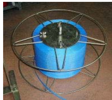
ドラムを再装着し完了 作業性良好です