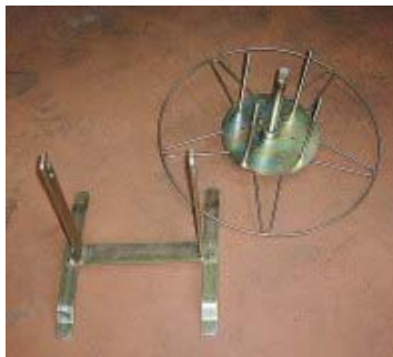
スタンドからドラム部を取り外します