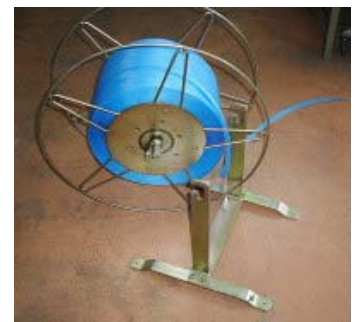
スタンドへドラムを装着します