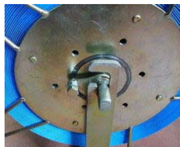
ボルトを調整することにより適度なブレーキ制御が可能です